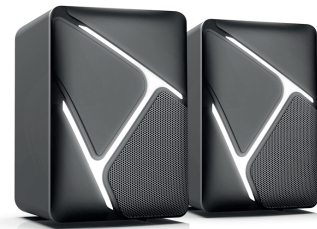
RLine mini (H-TK6)