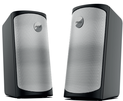
АКУСТИЧЕСКАЯ СИСТЕМА KNIGHT (H-TK8)