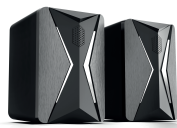
X line (H-TK11)