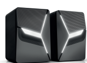
Evil Eye (H-TK10)