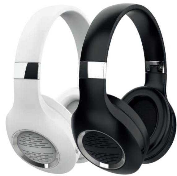
Модели: HTW-HX4 и HTW-HX5