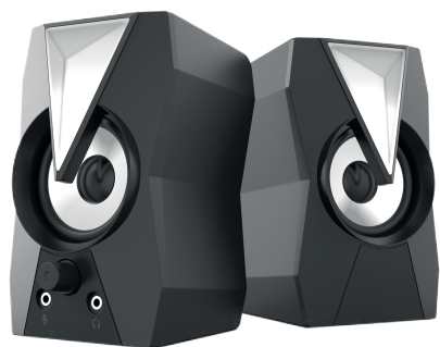
АКУСТИЧЕСКАЯ СИСТЕМА TRIANGLE (H-TK9)