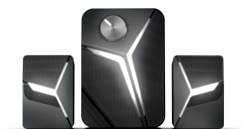
Evil Eye Trio (H-TR6(BK))