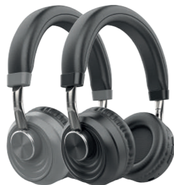
Модели: HTW-QTX6 и HTW-QTX7