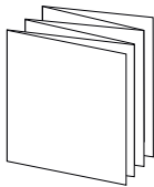
Инструкция по эксплуатации