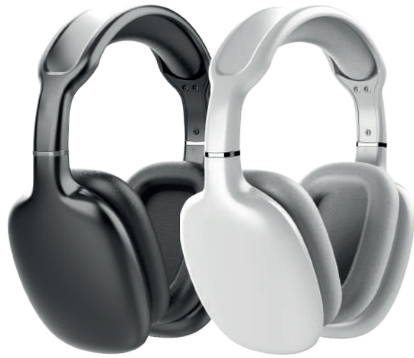
Модель: HTW-QTX10, HTW-QTX11 Артикул: HIPER LIVE QTX10, HIPER LIVE QTX11