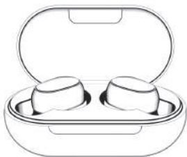
Кейс для зарядки и хранения