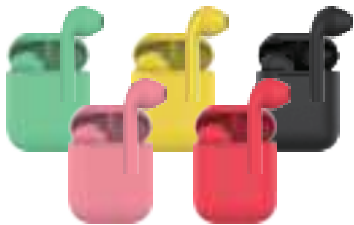
Модель: HTW-SA1, HTW-SA2, HTW-SA3, HTW-SA4, HTW-SA5